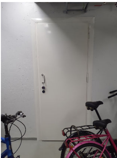
Kulku veden pääsululle