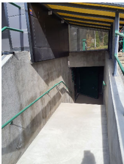
Kulku D-TALON vss