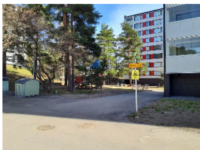
A- ja B-talon pelastustie